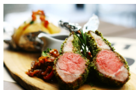
Lammfleisch mit dunklen Saucen