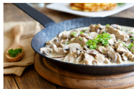
Kalbfleisch mit dunklen Saucen