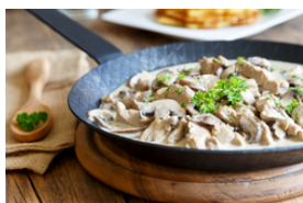
Kalb mit hellen Saucen