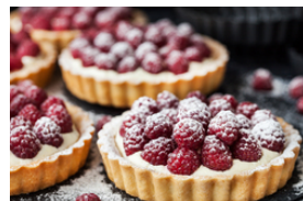
Desserts und Früchte