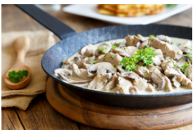
Kalbfleisch mit hellen Saucen