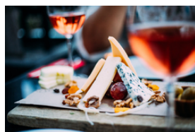
Hartkäse aus Ziegenmilch