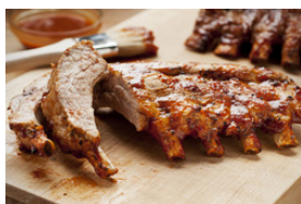
Schweinefleisch mit hellen Saucen