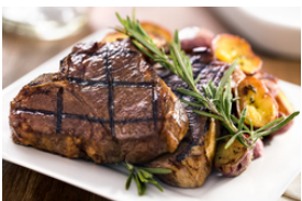
Rind mit hellen Saucen