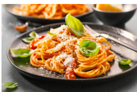
Pasta mit Fleisch