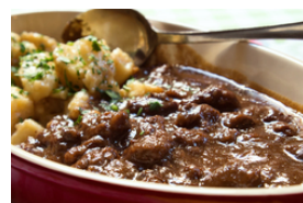
Wildfleisch mit dunklen Saucen, auch gegrillt oder gebraten